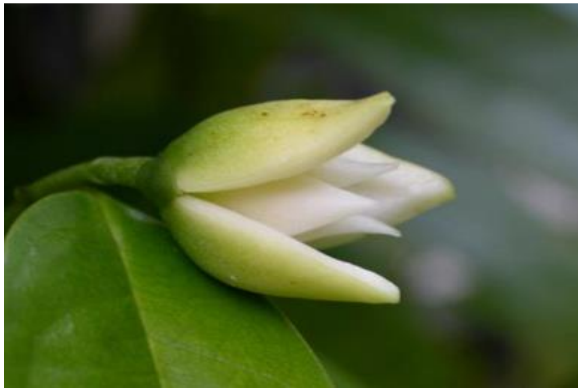
ดอกจำปูน