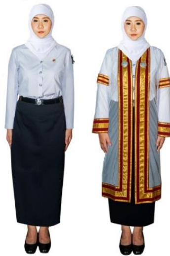
การแต่งกายของบัณฑิตหญิงมุสลิม

อนึ่ง ครุยปริญญาและเข็มวิทยฐานะ เป็นสิ่งมงคลสูงสุดซึ่งได้รับพระราชทาน จึงห้ามสวมพวงมาลัยติดดอกไม้ เครื่องประดับอื่นใดที่ครุยปริญญาหรือบนศีรษะ