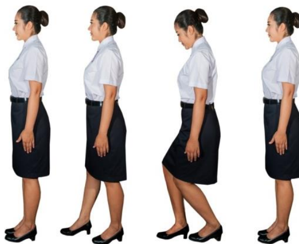
ขั้นตอนวิธีการถอนสายบัว

- ยืนตัวตรงเท้าชิดกัน แขนและมือปล่อยลงแนบลำตัวตามสบาย ชักเท้าข้างใดข้างหนึ่ง ตามถนัดไปด้านหลัง ไขว้ขาให้เข้าซ้อนกัน ปล่อยมือทั้งสองไว้ข้างลำตัว ขณะที่ไขว้ขามาด้านหลังให้ทิ้งน้ำหนัก ย่อตัวลงตรง ๆ พร้อมกับสายตาหลบต่ำ จากนั้นยืดตัวขึ้น ลากขาที่ไขว้กลับมาชิดกัน และยืนตรงตามเดิม