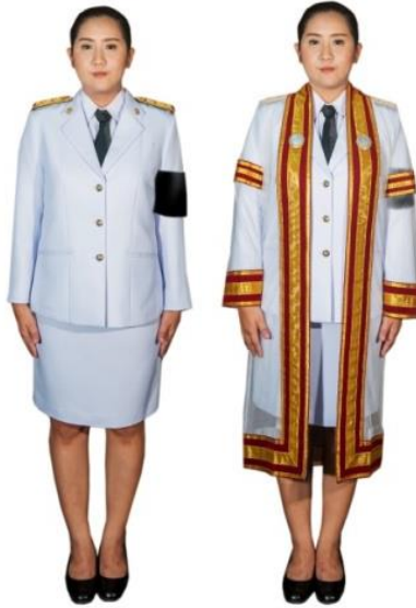
การแต่งกายของบัณฑิตหญิงที่เป็นข้าราชการหรือพนักงานของรัฐ