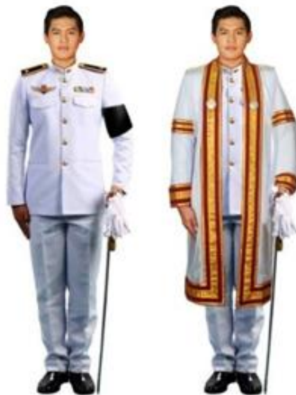
การแต่งกายของบัณฑิตที่เรียนจบนักศึกษาวิชาทหาร ชั้นปีที่ ๕