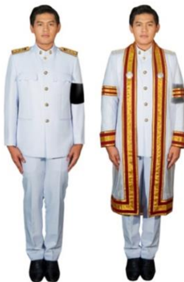
การแต่งกายของบัณฑิตชายที่เป็นข้าราชการ หรือพนักงานของรัฐ