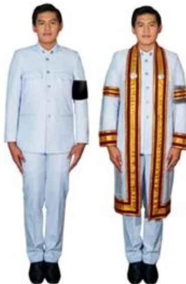
การแต่งกายของบัณฑิตชายที่ไม่ได้เป็นข้าราชการ หรือพนักงานของรัฐ