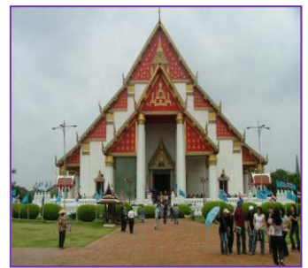
วิหารมงคลบพิตร จ.