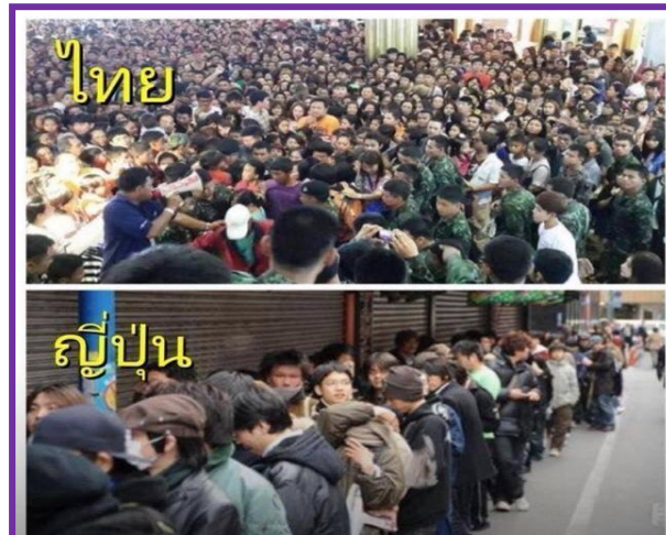
คนญี่ปุ่นรอบัตรเข้าชมภาพยนตร์