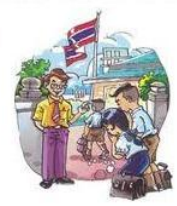
ความสุภาพ