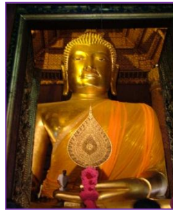
หลวงต่อโต วัดพนัญ