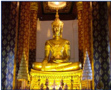
พระพุทธรูปทรงเครื่อง วัดหน้าพระ