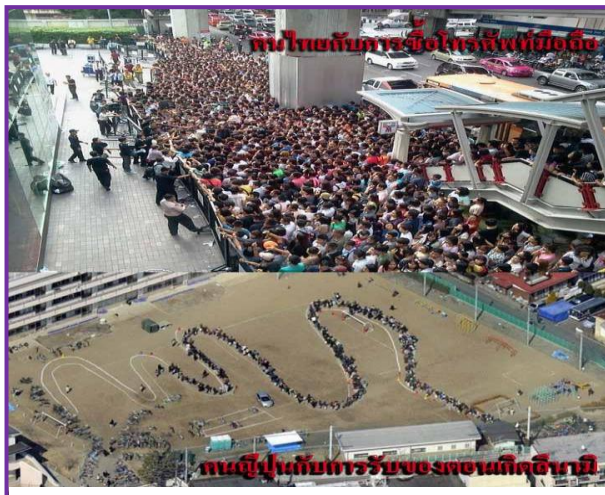
คนญี่ปุ่นกับการรับของตอนเกิดสึนามิ